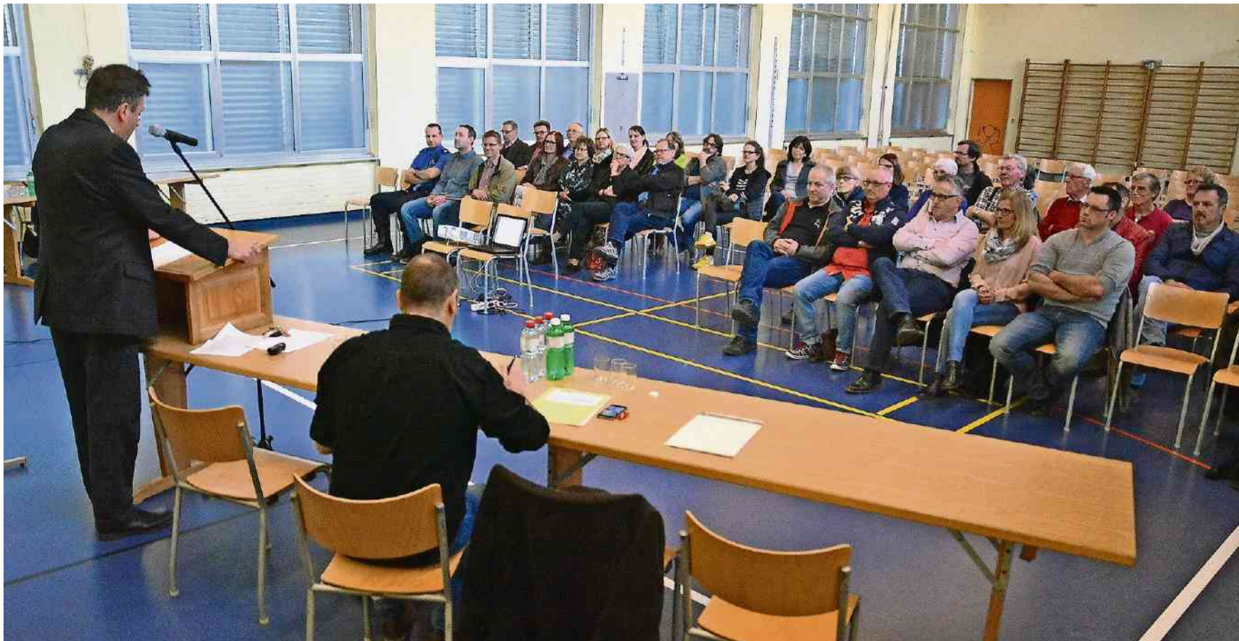
Luft draussen: Nur noch 40 Personen wollten sich am Montag zum bisherigen Betrieb äussern und Informationen zu einem «Reserve-Mietvertrag» hören.