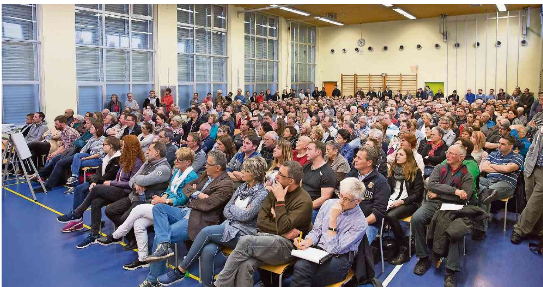
Spannung pur: Gegen 350 Personen hatten sich vor elf Monaten, am 25. April 2016, zur Informationsveranstaltung in die Turnhalle gedrängt.

Der Gospelchor «Sing2gether» aus Schönenwerd tritt mit seinem Jahreskonzert an zwei verschiedenen Orten auf. Das erste Konzert findet am Freitag, 31. März, um 20 Uhr in der römisch-katholischen Kirche in Schönenwerd statt. Nach dem Konzert gibt es einen Barbetrieb sowie eine Kaffee-stube. Nur das zweite Konzert vom Sonntag, 2. April wird in der reformierten Kirche in Däniken aufgeführt. An diesem Tag beginnt das Konzert von «Sing2gether» um 17 Uhr. Der Eintritt ist jeweils frei, für einen Zustupf an die Kosten bedankt sich der Chor. (MGT)